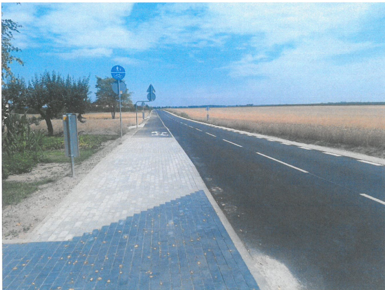
Droga w Rduć Nowym