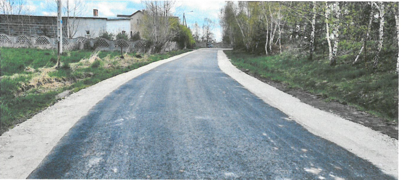
Fot.2 droga w Studzieniu