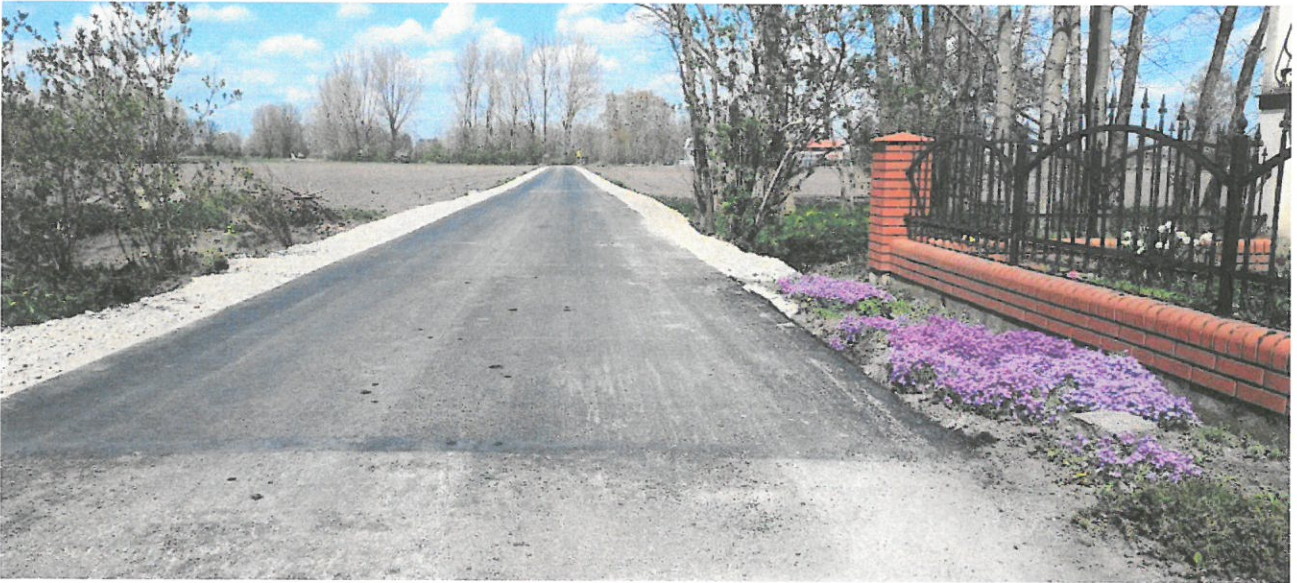
Fot.1 droga w Kocewi Małej