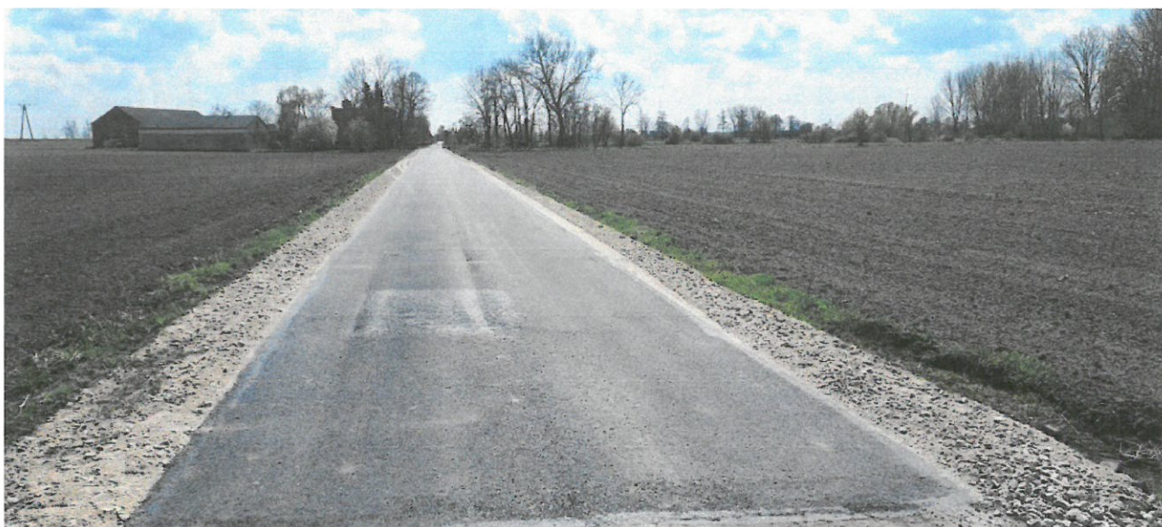
Fot.3 droga w Kocewi Małej