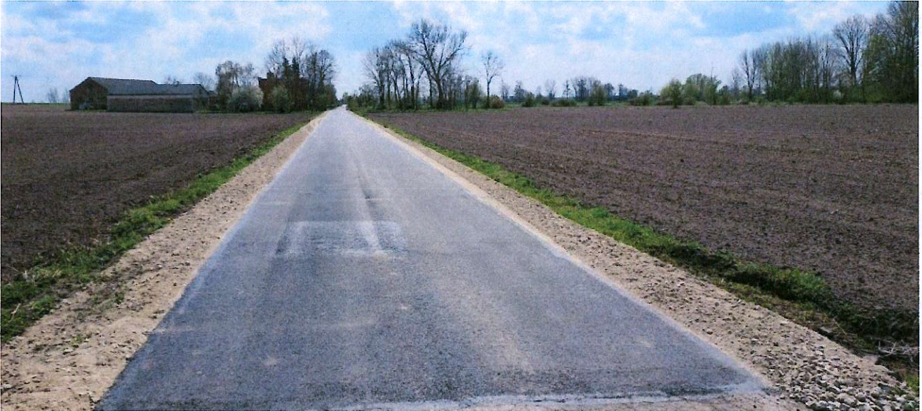
Fot.3 droga w Kocewi Małej