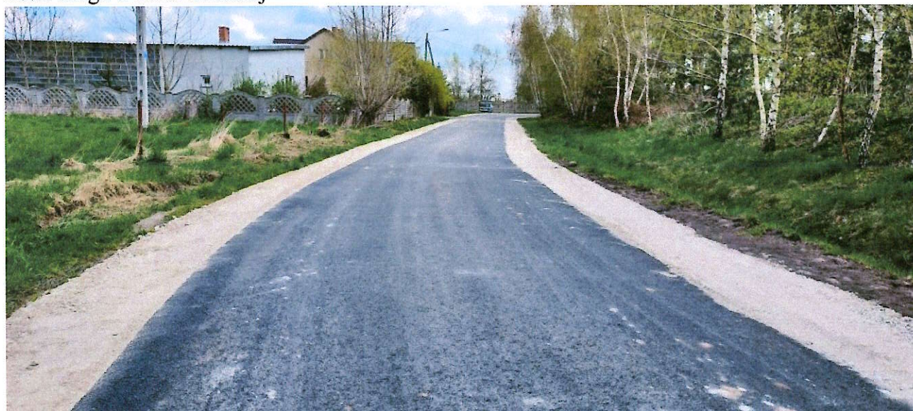
Fot.2 droga w Studzieniu