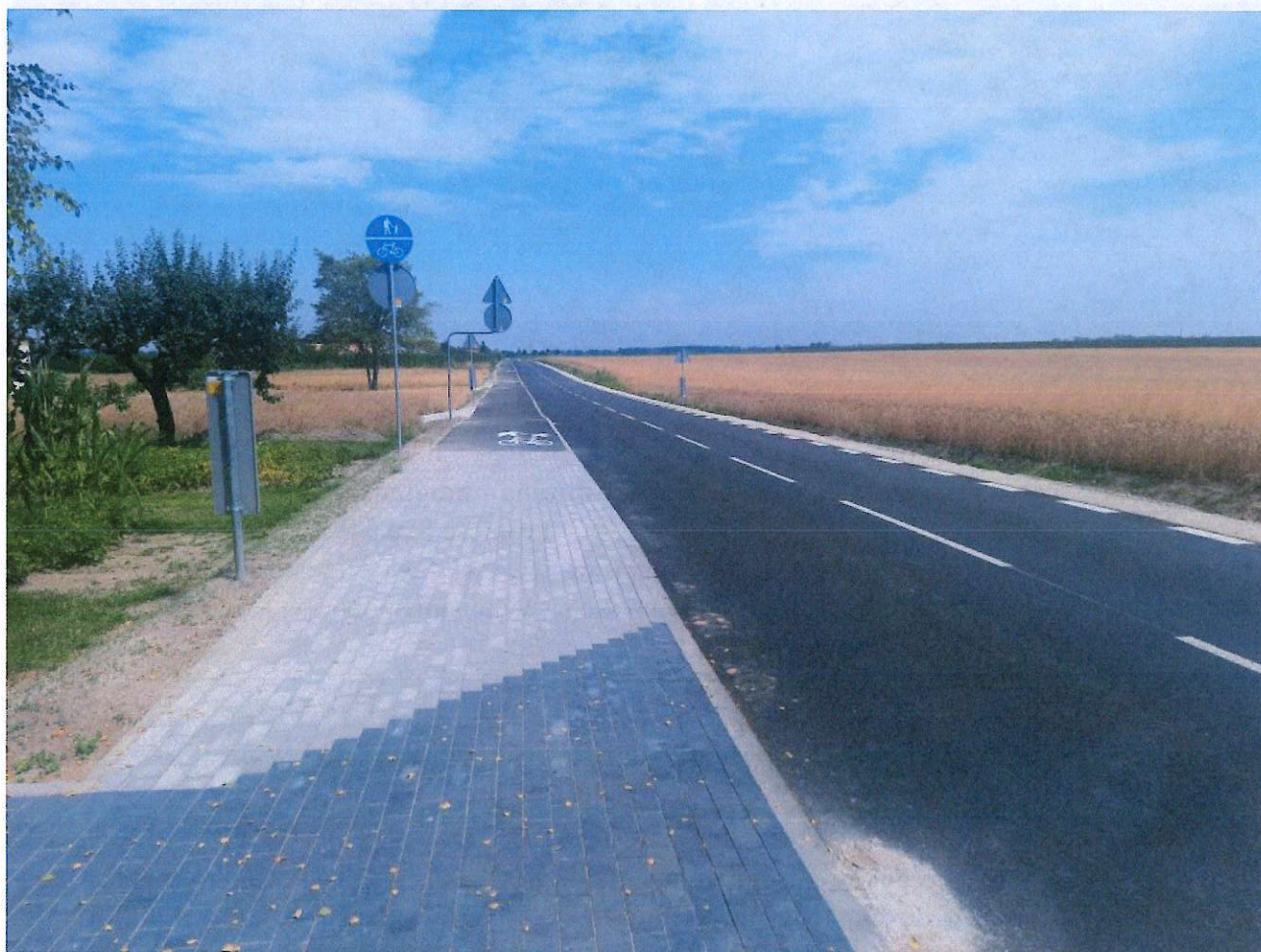
Droga w Rduć Nowym