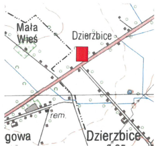
Szkic Orientacyjny 1:25000